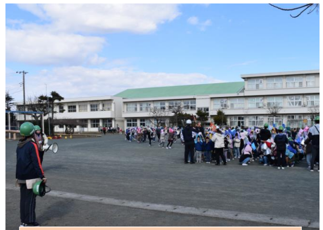
2月8日(木)避難訓練(予告なし)の様子

そんな私は、非常持ち出しのリストの検討と水・食料の備蓄を始め、車のガソリンが空になる前に、こまめに給油することを心がけています。