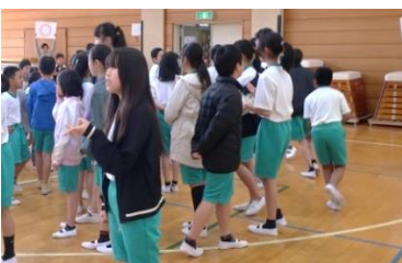
全校ゲーム大会。○×クイズ。