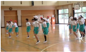
5年生体育:体づくり