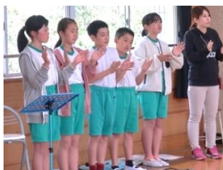
児童会児童が上手に進行。