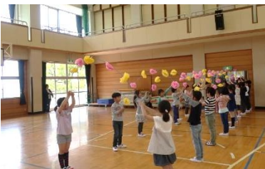
アーチをくぐって1年生入場