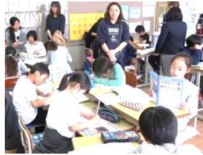
3年生国語 スピーチ原稿を 書いてクイズを出し合う。