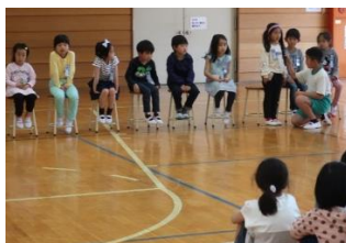
一人一人自己紹介しました。