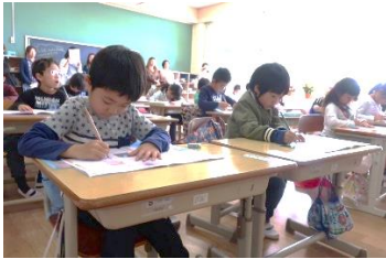
1年生国語 ひらがなの学習。 鉛筆を正しく持っています。