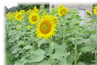
梅雨明けを待ちきれずに咲いたヒマワリ

新型コロナウイルス感染症予防対策に細心の注意を払いながら、一学期が無事に終了いたしました。お預かりした大切なお子様をご家庭にお返しいたします。この間保護者の皆様には、お子様の体調の管理や検温へのご協力、例年とは異なる様々な教育活動等へのご理解等、多大なご支援を賜りました。本当にありがとうございます。この度のコロナ禍への収束の見通しが、依然つかない中、ウイズ・コロナの新しい生活スタイルの定着と感染症予防に引き続き努力しつつ、二学期以降も教育活動の一層の充実に努めて参ります。