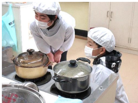
5年生 家庭科 調理実習