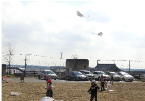
1年生 生活科 凧あげ