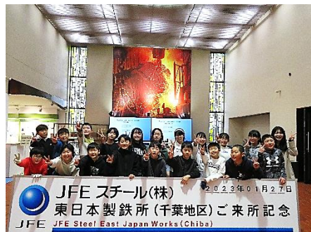
5年生 社会科見学 JFE・フクダ電子アリーナ他