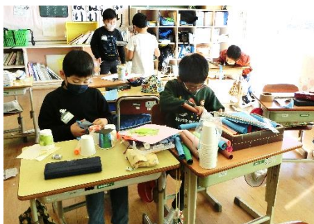
2年生 生活科 おもちゃ ランドのおもちゃづくり