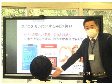
6年生 千葉科学大学 大高教授 による薬物乱用防止教室