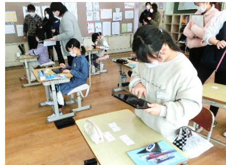
3年生 算数 ICTを活用した授業