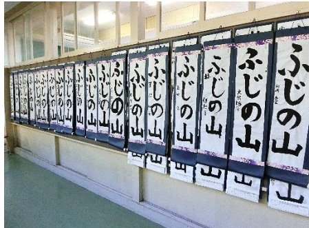
各学年の廊下に飾られた 書初め作品

1月もモノづくり・実習・校外学習など、学年の発達段階に応じた様々な学習が行われています。