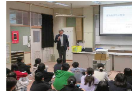
〈11/20 6年薬物乱用防止教室〉