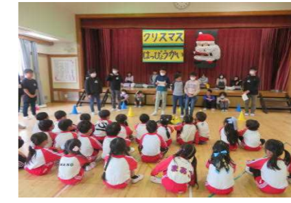
〈11/27 5年幼稚園との交流〉