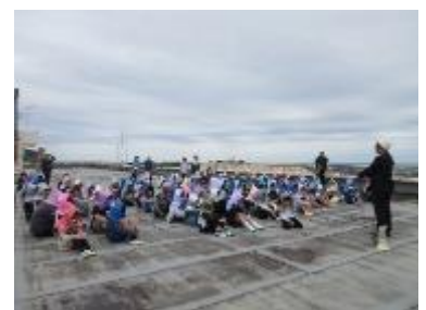
防災頭巾を被り屋上へ避難

屋上では、安全主任から避難時の約束を伝え、また校長から東日本大震災時の様子を伝え、子供たちの防災に対する意識を高めることができました。