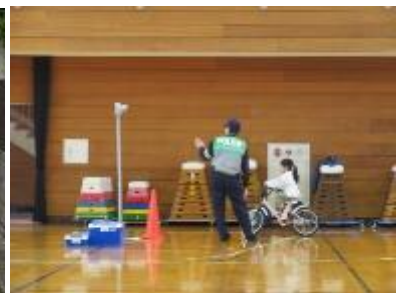
一人ずつ歩き方や自転車の乗り方の指導を受けました