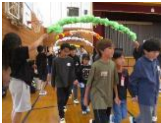
5年生がアーチでお迎え

会の中では、6年生が1年生の面倒を見る場面も多くあり、最高学年らしい行動が随所に見られました。これからも学校のリーダーとなり、様々な場面で活躍してくれることでしょう。