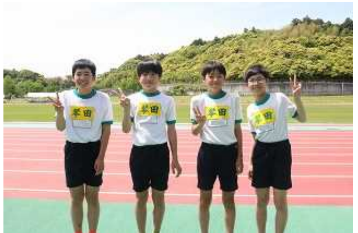
《4×100mリレー 6年男子:第1位 大会新記録まで、あと0.33秒の56秒36でした》