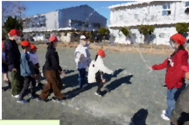
兄弟学年による長縄跳び(業間活動)

このところ、乾燥した寒い日が続いていますが、子ども達は寒さをものともせず、休み時間には毎日元気に外で遊んでいます。1月13日(火)からは全校での業間長縄跳びが始まりました。今年は2月5日までの活動期間中、前半は兄弟学年(1・6年、2・5年、3・4年)で行い、後半はクラスごとに行っています。3分間で跳んだ回数の記録更新を目指し、日々練習に励んでいます。