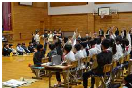
1年生 虫とはたらくじどうしゃ

発表をご覧になった保護者の皆様、いかがでしたでしょうか？子どもたちなりの精一杯取り組む姿が、伝わっていると嬉しいです。お仕事の関係等でご覧になれなかった保護者の皆様も、下の写真で少しでもその様子を感じていただけると幸いです。