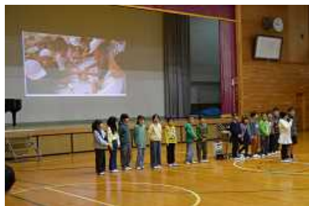
3年生 野菜と花の成長記録