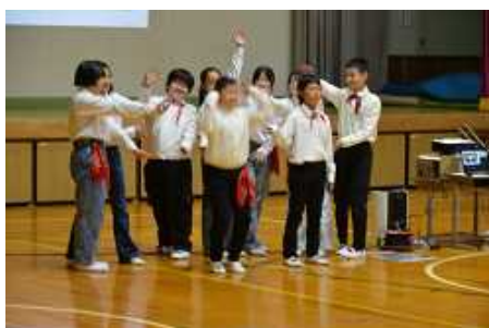
6年生 修学旅行 鎌倉