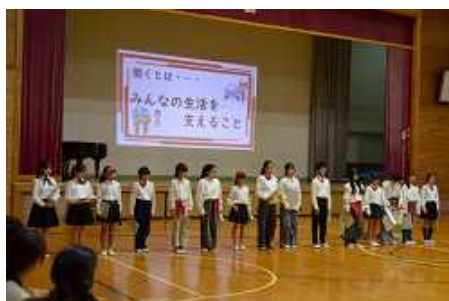
5年生 職業の魅力発信