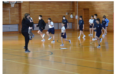
ランニングにもコツがあります