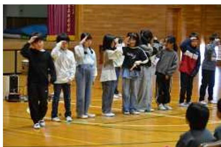
4年生 認知症について