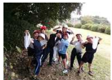
どんぐり拾ったよ（2年生）