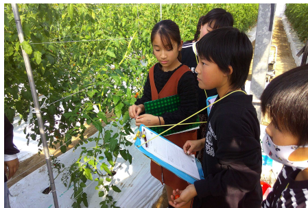
花香さんトマトハウス