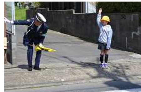
手を挙げて横断歩道を渡ります