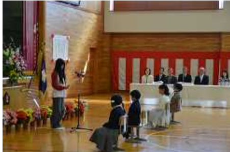
お話も姿勢よく聞けています