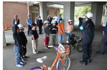
ルールのクイズにも積極的に