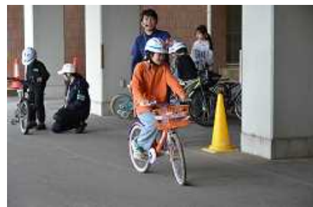
1人ずつ自転車をこいで

この教室の実施にあたり、準備・運営を中心となって進めていただいた旭警察署、交通安全指導員、市民生活課の皆様、ご協力いただいた保護者の皆様、子どもたちのためにありがとうございました。