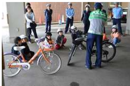
警察署の方からは点検について

3年生は、自転車の乗り方や点検の仕方について教えていただきました。クイズ形式で交通ルールについて考えたり、実際に自転車に乗って一時停止や信号に注意したりと、役立つことをたくさん学ぶことができました。