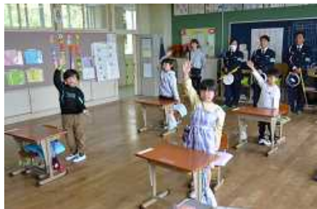
まずは教室で練習

1年生は、道路の歩き方や横断歩道の渡り方について教室で確認し、実際に道路に出て習ったことを実践しました。天候が心配されましたが、晴天のもと実施することができました。