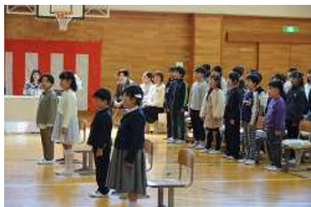
立ち姿に凛々しさを感じます

4月8日、令和8年度入学式を行いました。4名の新入生は、自分の名前が呼ばれたら大きな声で返事をし、お話もしっかりと聞くことができました。萬歳小最後の入学生、今後は60名の在校生とともに職員一同、楽しく学習や諸活動に取り組めるよう支えていきたいと思えます。そして1年生一人ひとりが様々なことに挑戦し、学力向上はもちろんのこと、心も体も大きく成長することを期待しています。