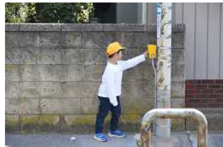
正門前は押しボタンを押して

3年生は、自転車の乗り方や点検の仕方について教えていただきました。クイズ形式で交通ルールについて考えたり、実際に自転車に乗って一時停止や信号に注意したりと、役立つことをたくさん学ぶことができました。