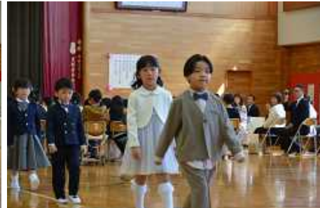
みんな堂々とした姿で退場