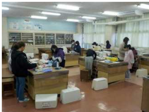
〈ホームメイキングクラブ〉

今年度は年4回の活動です。活動に制限のある中ですが、学年の異なる仲間と、自主的な活動を目指してがんばっています。