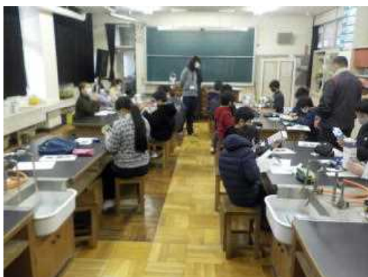
〈ものづくりクラブ〉