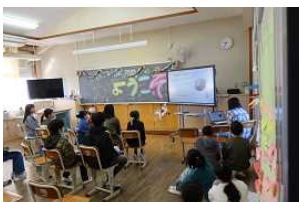
【5年5年生で学んだこと特集】