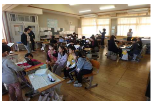
【3年調べてみたよ! 世界の食べ物・料理+α】