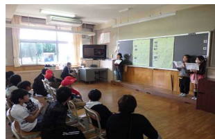
【2年伝えよう! わたしたちのまち探検】