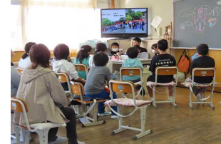
【6年修学旅行in神奈川】

1~3年、4~6年の児童で、お互いに発表を聞き合ったり、参加型で体験したりと、学校全体で発表を楽しみました。参観して下さった保護者の皆様も、ありがとうございました。