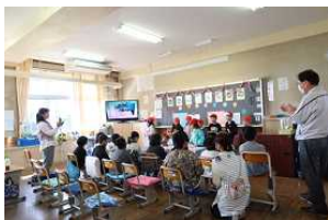
【1年あきのおくりもの】

11月8日(金)に、三川っ子学習発表会を開催しました。これまでに学習していた内容を、テーマごとに発表し、さらに学習を深めました。