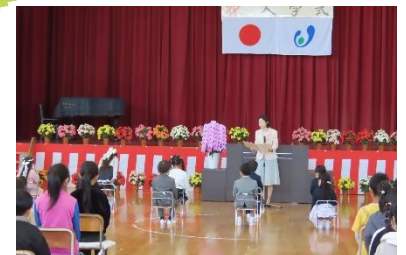
大きな声で返事ができました！

式後の、保護者の皆様との記念撮影のときには、ほっとした表情が多く見られ、緊張していたことがよくわかりました。保護者の皆様の優しい見守りが大きな支えになっていることを実感しました。