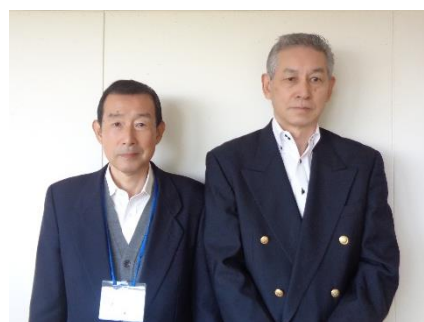
千葉県警察本部生活安全部少年課 北総地区少年センター