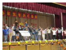
2年生 やさし万博 2026